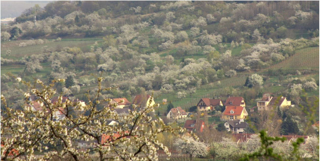
Instant de plaisir visuel lorsque le Bischenberg est en fleurs ... de cerisiers

Cette explosion de couleurs est sublimée au lointain par les feuillus des forêts vosgiennes qui osent leurs premiers dégradés de vert. Mais attention à ne pas manquer ce scintillement de blancs qui peut être assez bref lorsqu'un subi coup de vent met à terre cette immesurable quantité de pétales éphémères, juste visibles le temps de la pollinisation des fleurs malheureusement pas toujours garantie à souhait pour une bonne récolte fruitière, et ce en cas de gel ou de pluie abondante.